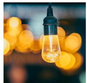
Rouillac réduit son coût énergétique