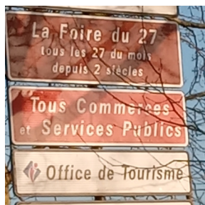
Nouveaux commerces en centre ville

Cérémonie des vœux : vendredi 6 janvier à 19h au vingt-sept